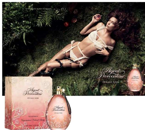
Рисунок на флаконе - переплетение нежных, благородных цветов. Однако все не так просто - как и главная героиня, это красивые цветы с колючими шипами. Черная цепочка на горлышке флакона подчеркивает скрытую, темную сторону страсти. Упаковка флакона выполнена в том же дизайне, утонченном и несомненно провокационном.

PETALE NOIR, пер. с фр., - черный лепесток. Современная соблазнительница, от природы уверенная в себе, но владеющая более искусными, изысканными и сложными методами обольщения. Это женщина, которая знает, чего она хочет и как она хочет этого добиться. Не поддавайтесь ее чарам, они могут быть обманчивы! Благодаря своему тонкому подходу она очарует своего мужчину и завладеет им.