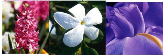
гиацинт, жасмин, ирис