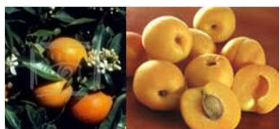
абрикос, цветы апельсинов