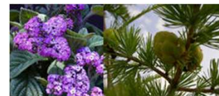
гелиотроп, пихтовый бальзам