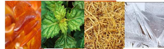
Амбра, пачули, ветивер, белый мускус