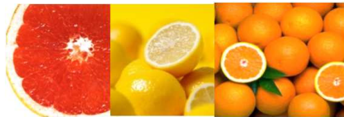
розовый перец, лимон, мандарин